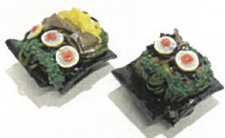
実際につくった瓦そばマグネット盛り付け方を変えて2種類完成