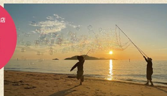
第14回豊浦フォトコンテスト会長賞作品「梅雨時間」