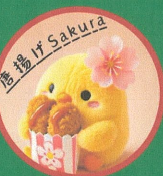
唐揚げ・すじ煮込