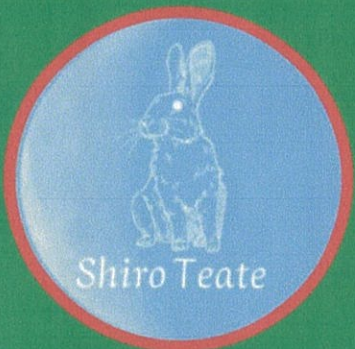
ハンドトリートメント マッサージ